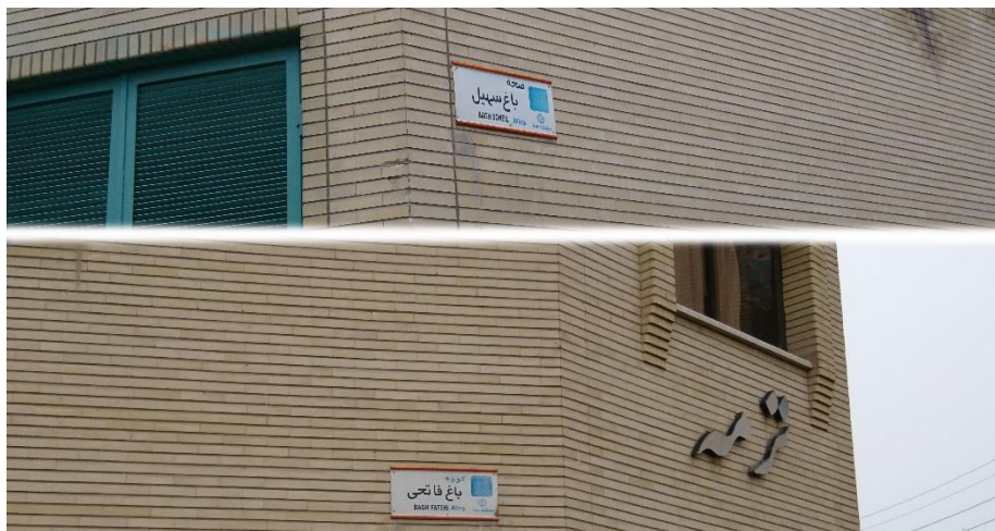
تصویر 2 نام کوچه باغ و محله باغ بر روی کوچه و محله های شهر اصفهان

کوچه باغ، به کوچه‌ای که راهی به باغ داشته باشد یا از کنار باغ گذرد، گفته می‌شود. در پی شکل گرفتن باغ و ایجاد سکونتگاه میان و یا در کنار باغ، مفهوم خانه باغ شکل گرفت و این خانه باغ‌ها در کنار یکدیگر کوچه باغ‌ها را شکل دادند و از کنار هم قرار گرفتن این کوچه باغ‌ها، باغ محله و باغ شهر شکل گرفته است. با توجه به تعریف ارایه شده در شهر اصفهان هنوز می‌توان کوچه باغ‌ها را در گوشه، گوشه‌ی شهر مانند محله‌های ناژوان یا رهنان مشاهده کرد؛ همچنین